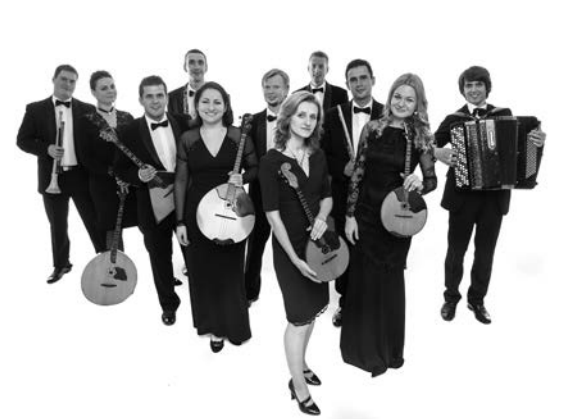
Ансамбль молодых солистов оркестра имени Н.П. Осипова / Ensemble of Young Soloists of the Ossipov Orchestra