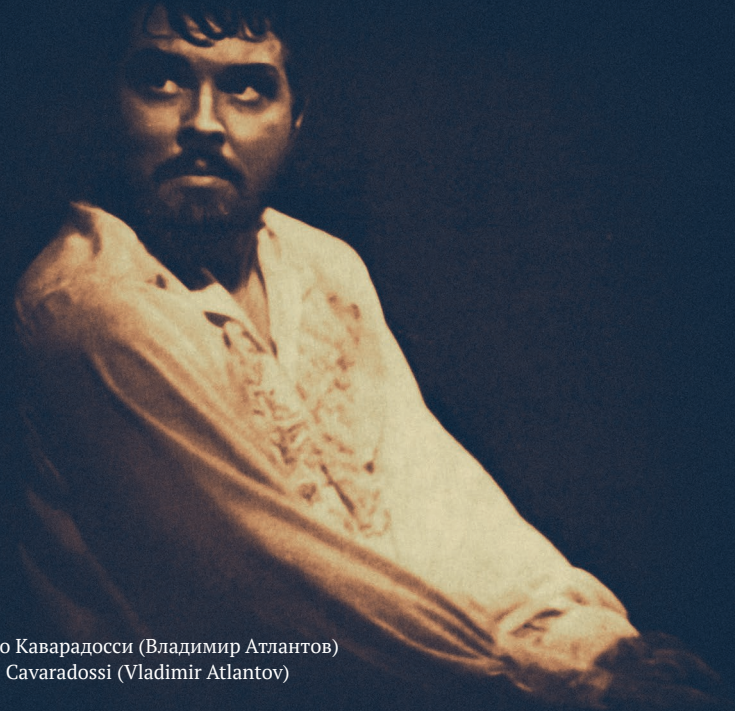
Марио Каварадосси (Владимир Атлантов) Mario Cavaradossi (Vladimir Atlantov)

Spoletta and the gendarmes climb the tower. Scarpia’s body has been found, and now Tosca will pay a heavy price for her crime. But Tosca does not value her life anymore. She runs to the parapet and hurls herself over the edge to her death.