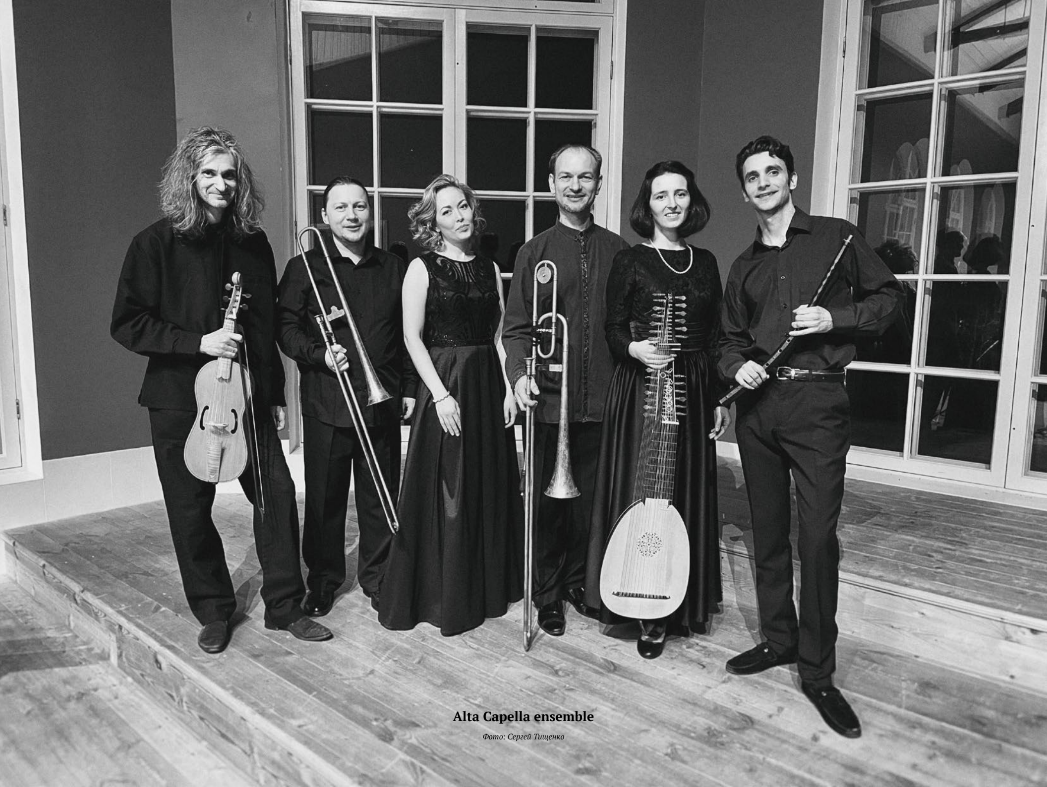
Alta Capella ensemble